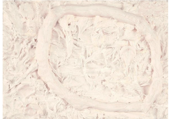
Ring , 2003 (détail), huile sur toile, 20 x 15 cm.

Exposition du 30 septembre au 13 octobre 2006